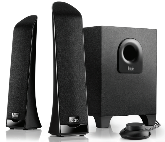
2.1 multimedia speakers