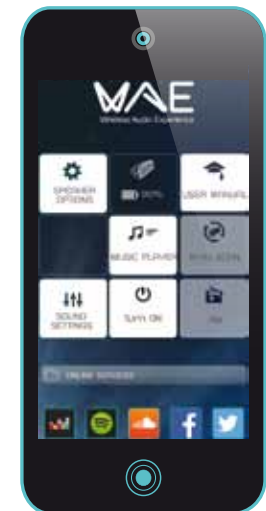
Κύρια οθόνη σε κατάσταση αναμονής